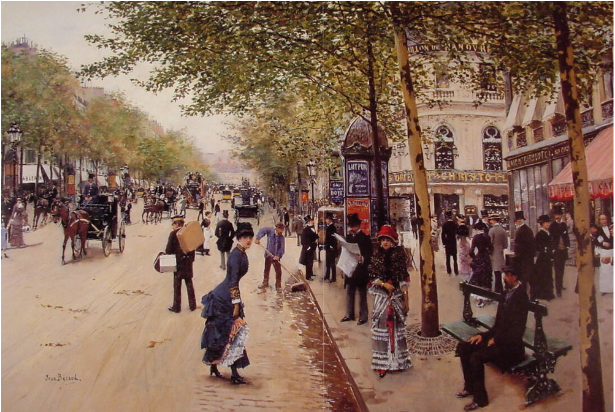
Jean Béraud (1848–1935) Boulevard de Capucines

Quinzième rencontre annuelle de l'Association canadienne d'études francophones du XIX e siècle