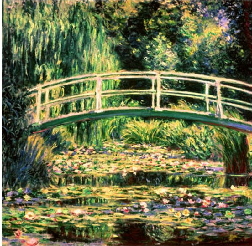
Claude Monet , Jardin à Giverny , vers 1890, huile sur toile.

Quatorzième rencontre annuelle de l'Association canadienne d'études francophones du XIX e siècle